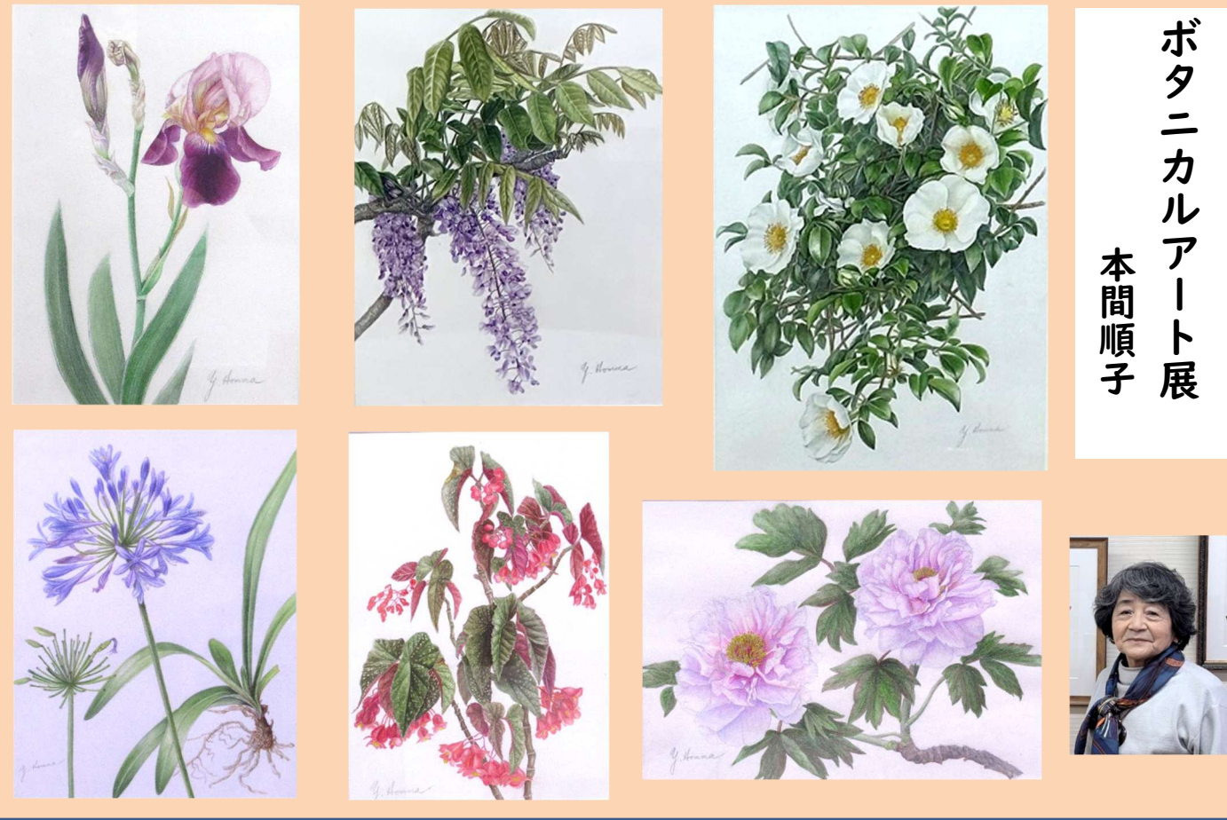
ボタニカル アート展 本間順子