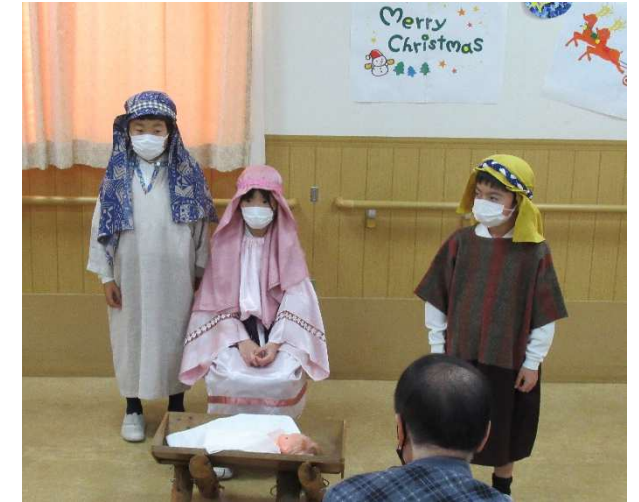
光風台三育小学校の児童による 降誕劇のオペレッタ