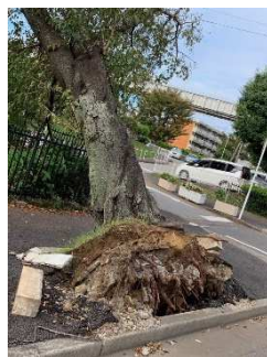
みつわ台 桜の街路樹

体力的にもきつくなっていますが、皆様と励まし協力し合いながら、一日も早く平常に戻るようお祈り致します。