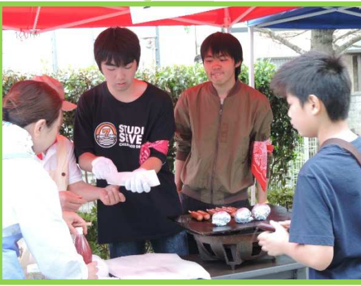
学生さんにも参加頂いています！