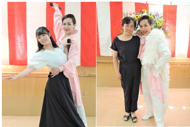
夏峰千様とMAI様の息はピッタリでした!