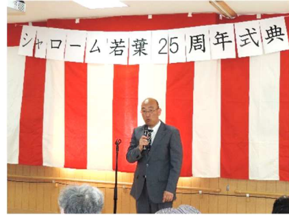
法人を代表してシャローム東久留米の我謝施設長(写真左)とシャローム若葉の高幣施設長(写真右)の挨拶