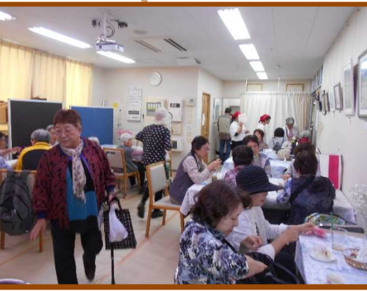
喫茶店でちょっと一息！

抽選会の1等はまさかのシャローム若葉職員が当選！！ お子さんが引いたとの事ですが、 無欲の勝利 ってヤツでしょうか？？