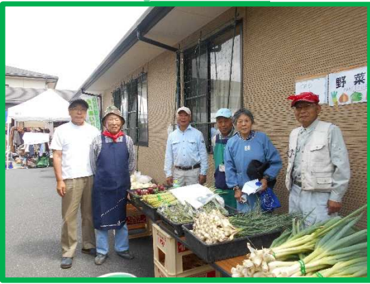
野菜は毎年絶好調の売れ行き！