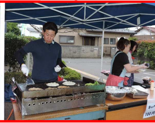
暑い中での鉄板は大仕事です！