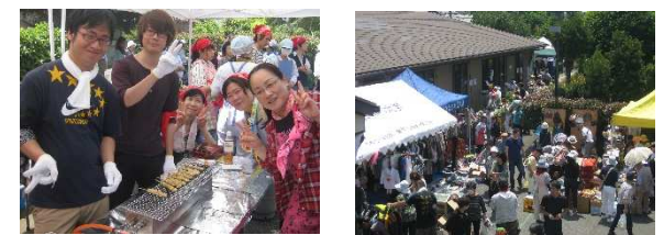
※写真は昨年のものです。