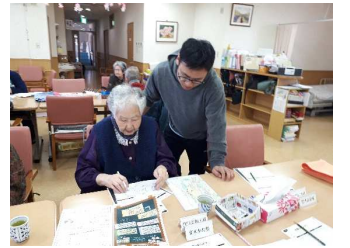
一年も経つと頼もしくも！？

この調子で練習を重ねて、一日でも早くご利用者の送迎が出来るように頑張っていきたいと思っています。