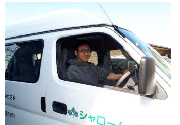
※デビューの際はご協力の程宜しくお願致します。