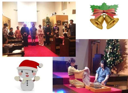
※写真は昨年のものです。

日時 12月23日(土) 13:30～15:00 場所 SDA千葉キリスト教会 3F 教会堂 演目: ウェンセスラス王様