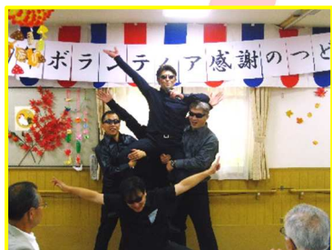
練習では苦勞をしていましたが本番に強い所を魅せちゃいました