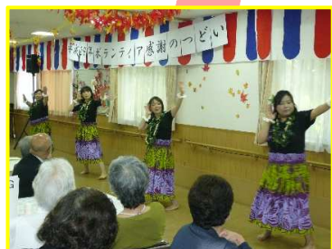
最後はしっかりとフラダンスで