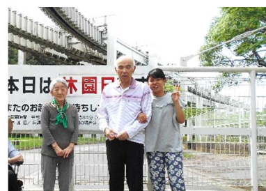
外出行事にも参加!