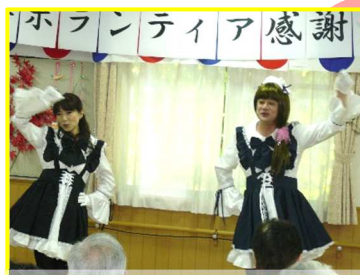
右の方は女性!?男性!?