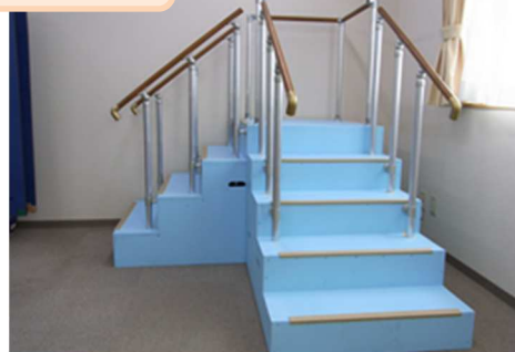
4. アルミパイプと32mmの木製手すりは自在金具で固定します。中央の手すりは階段の向きに合わせて変更出来るよう回転止めねじが付き金具を使用しています。