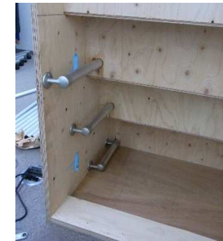
3. 35mmアルミパイプと直止金具で固定します。