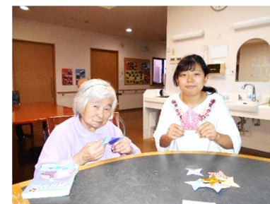
施設内はもちろんの事

日にちを重ねていくたびに、ご利用の方と色々な話ができるようになり、今はとても楽しく仕事が出来ています。介助の場面では、初めの頃は慣れないことが多くて戸惑ってばかりだったのですが、男性の方の髭剃りのお手伝いをしたり、その方の注意しなければならない事を今では覚えて介助が出来るようになりました。これからも、ご利用の方や職員の方と関わり合い、勉強をしていきたいと思っております。よろしくお願いいたします。