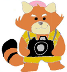
写真家 シャロン (?) さん