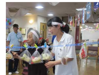
運動会での一コマ