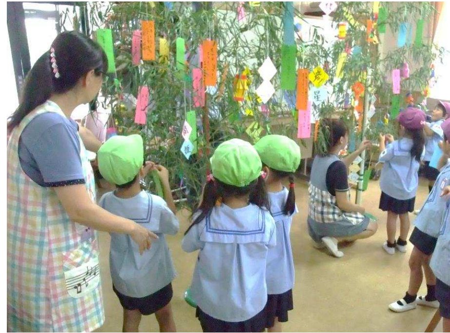
若松台幼稚園の園児たちによる七夕の飾り付け