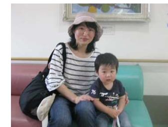
バザーでお子さんと一緒に はいっ!チーズ!