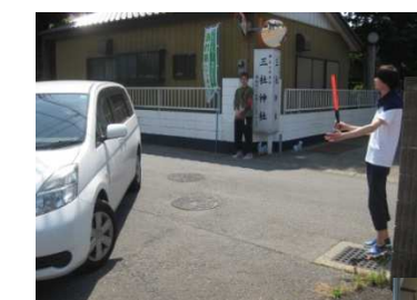
暑い中、車両の誘導、本当にお疲れ様でした。