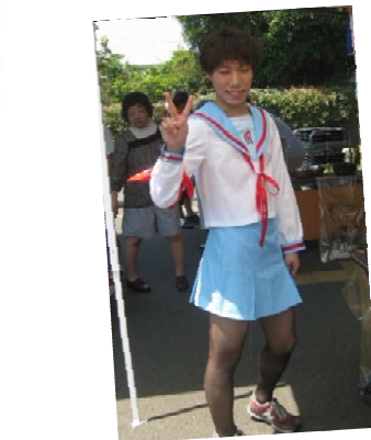
こちらはなんと自前で用意してくれました！感謝！