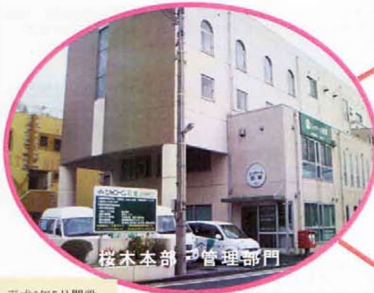
桜木本部 管理部門

平成18年4月 地域包括支援センター受託 総合相談・地域ネットワーク事業・権利擁護事業 介護予防事業・予防ケアプラン作成・出前講座