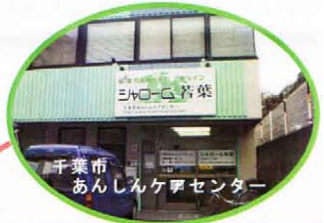
千葉市 あんしんセンター

光陰矢の如し、千葉市若葉区に産声をあげ15年が経過しました。地域密着、住民参加型を掲げ、高齢者福祉の向上を願い、単独型デイサービスセンターの開所に始まり、介護保険制度（平成12年）以降、職員も今では177名の働き人に成長させていただきました。ここに15年の節目を迎えられたこと感謝でいっぱいです。地域の皆様の絶大なるご協力やご支援にこの紙面から心からの御礼を申し上げます。事業がこのように発展してきたこと素晴らしいスタッフ一人ひとりが50文字にこめて、新たな思いをもって、関連機関・地域のみなさまと共に歩んで参ります。