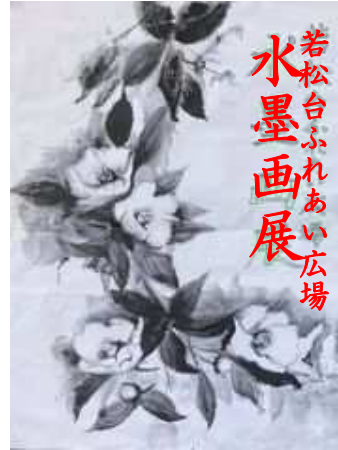
若松台ふれあい広場 水墨画展