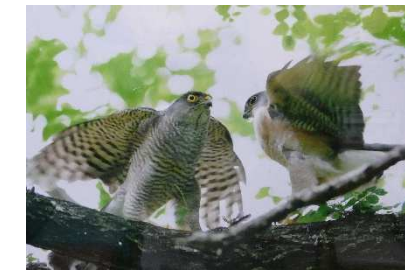
①見つめ合う ②ツミ ③熱田武