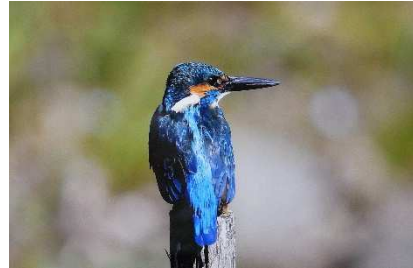
①視線 ②カワセミ ③石屋正幸