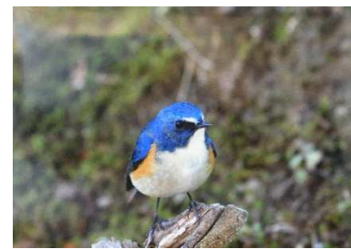
①おすまし ②ルリビタキ ③田原巖