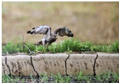
①生きる力 ②サシバ ③小嶋正男