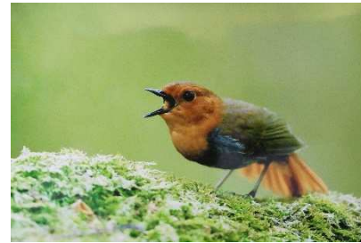
①威嚇 ②コマドリ ③川面寛