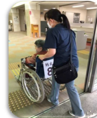
通院同行（自費サービス）