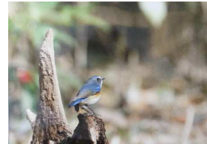
①瑠璃鶉 ②ルリビタキ ③栄倉清一