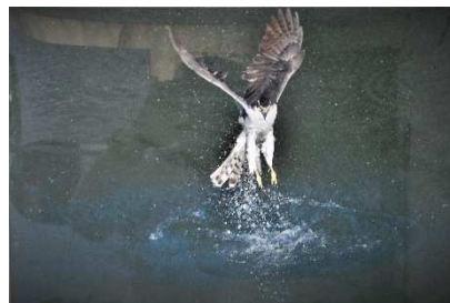
①狩りに失敗 ②オオタカ ③渡辺正男