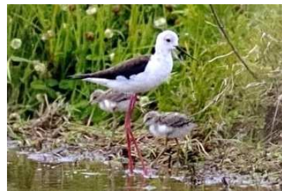
①散歩 ②セイタカシギ ③渡辺三男