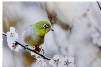
①梅目白 ②目白 ③宇津木章雄