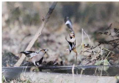
①お待たせ！ ②シメ ③栗山清